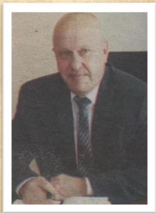
Сехчин Владимир Илларионович (2012 – 2016)