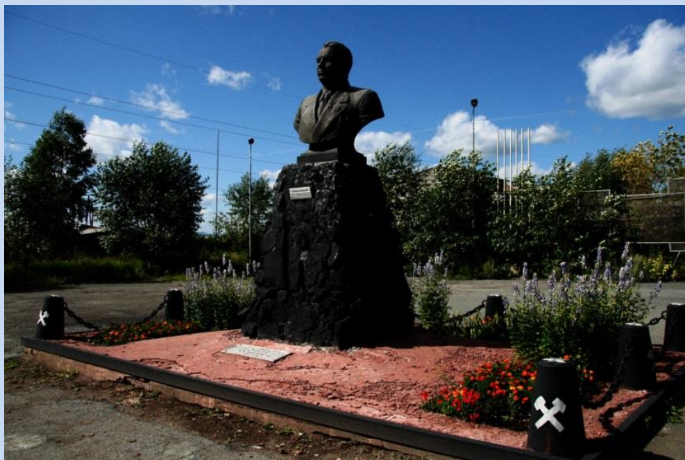
Памятник В. В. Вахрушеву