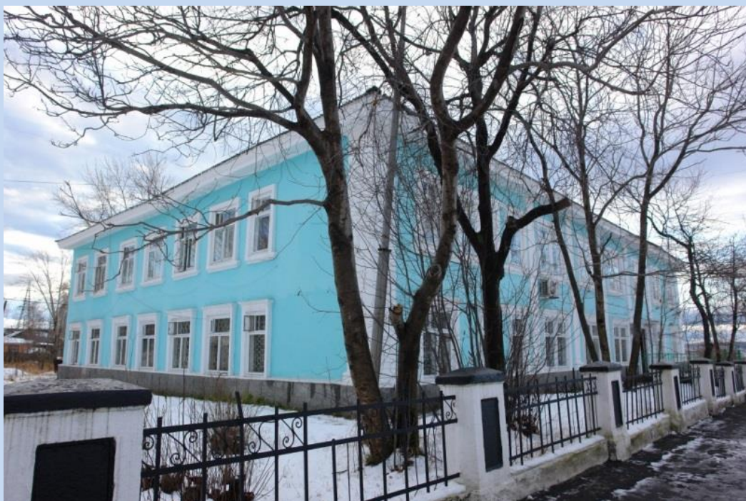
Здание ОАО «Вахрушевуголь»