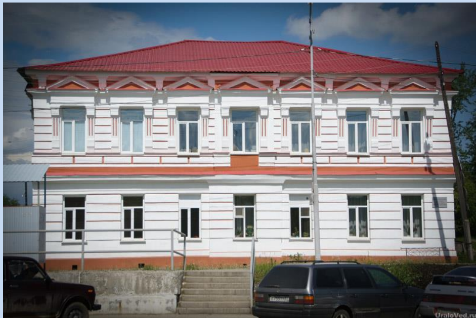
Здание бывшего акционерного общества Богословского горного округа. Фот. Н. Князева, 2017 г.