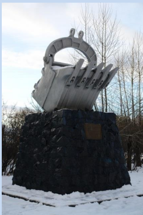
Памятник в честь добычи 300-миллионной тонны угля на Богословском месторождении