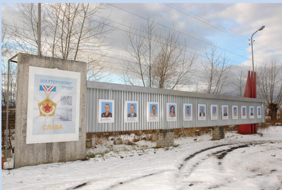
Доска почета на площади им. В. В. Вахрушева