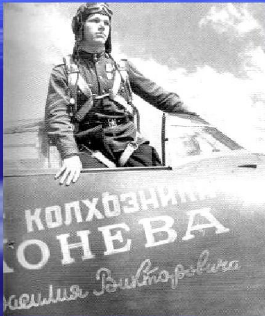
Ла-5 И.Н. Кожедуба на составе 240-го ИАП.

Лишь в 1943 году Кожедуб попал на фронт. Мастерски владея истребителем, он стал одерживать победы. Уже в феврале 1944 года за 26 сбитых самолетов врага ему было присвоено звание Героя Советского Союза ( в августе 1944 года он стал дважды героем)