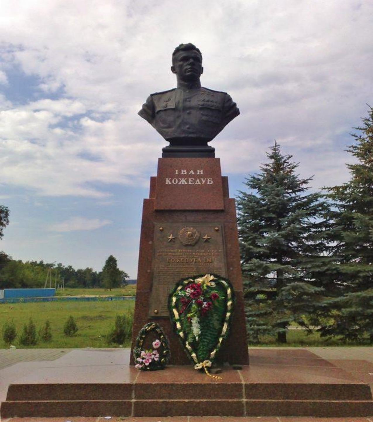
Памятник в селе Ображиевка