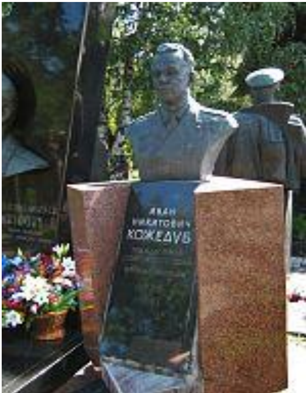
Памятник на Новодевичьем кладбище в Москве