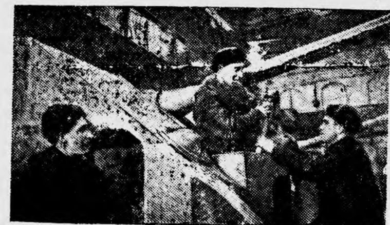
На Н-ском заводе. Рабочие готовят в сдаче артиллерийские орудия.