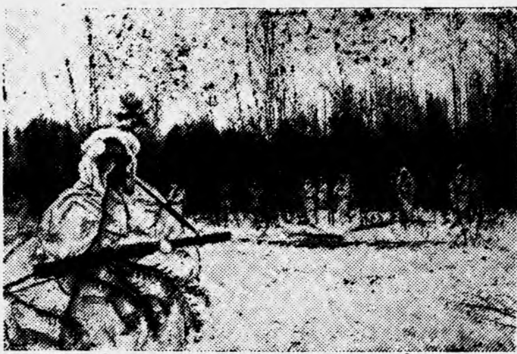
На снимке: бойцы прочесывают лес и кустарники в балке.